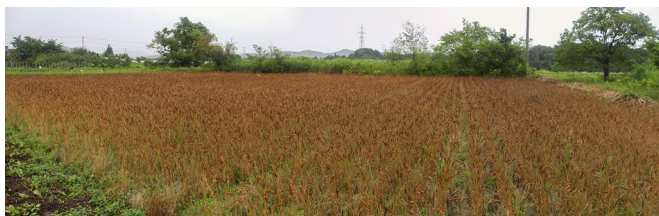
千咲原 大江圃場 南部小麦