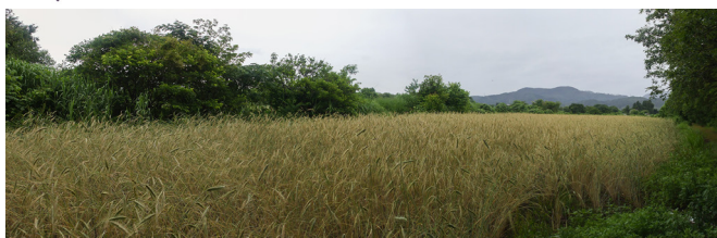
千咲原 渡辺圃場 ライ麦